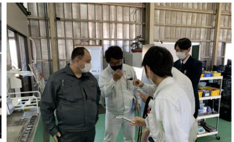
企業間活動の様子