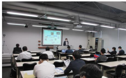
プロジェクト会合の様子