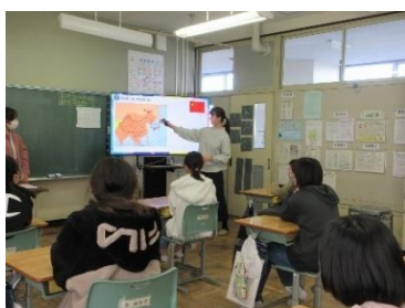
中国の国土について